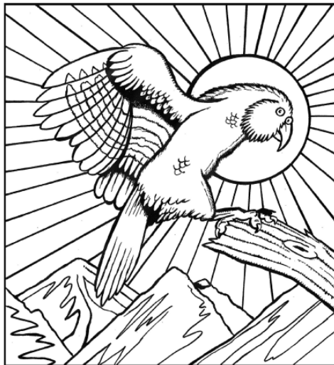
Kea - Most clever bird

In the 1990's a television show tried to find the world's most clever animal (not counting chimpanzees, gorillas and orangutans). They used lots of tests on all sorts of different animals and the winner was a New Zealand native bird - the kea!